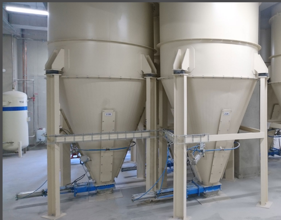
Nožová šoupátka typ C s pneupohonem na mletý vápenc v provozu MIKROP, Čebín .