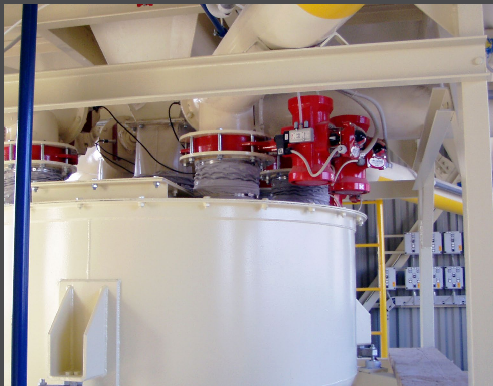
Uzavírací klapky FLW3 s polyisoprénovou manžetou a pneumatickým pohonem. Násyp práškové směsi do váhy ve výrobně pastových omítek Cemix, Čebín .

Doporučujeme, abyste za účelem výběru vhodných typů a materiálů těles, uzavíracích a těsnících prvků pro konkrétní pracovní podmínky využili naší technické podpory: